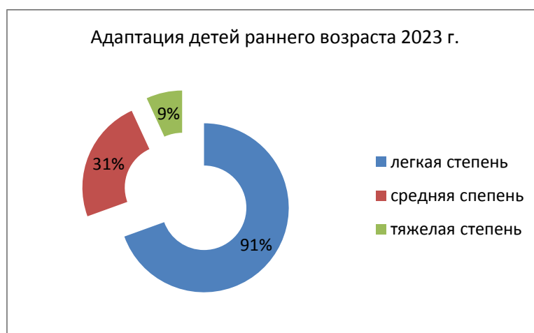
Рис.2. Итоги процесса адаптации детей раннего возраста (по состоянию на 29.12.2023г.)

В 2023 году в группы раннего возраста принят 31 дошкольник в возрасте от 1, 4 месяцев до 3 лет.